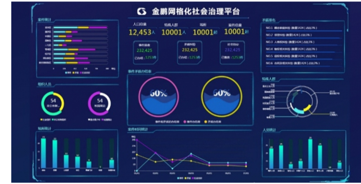
多网合一 一网统管 闭环协同 精准服务 一屏可视 精准决策 全民参与 多元共治

为深入贯彻落实国家总体要求，金鹏信息凭借多年网格化治理实践经验，与时俱进、顺势而为，积极探索“党建引领+多网融合+共治共享”社会治理模式，在已有成熟的网格化产品基础上，创新模式、深化应用，全面整合党群建设、政务服务、综治维稳、社区服务等各类资源，搭建网格化管理、精细化服务、数字化支撑、开放共享的综合社会治理平台。